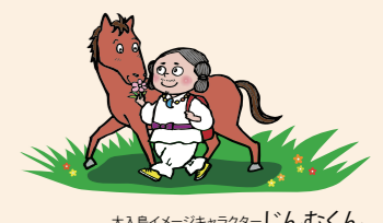
大入島イメージキャラクターじんむくん